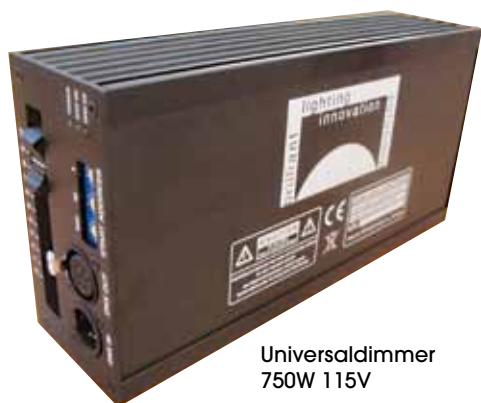
Universaldimmer 750W 115V