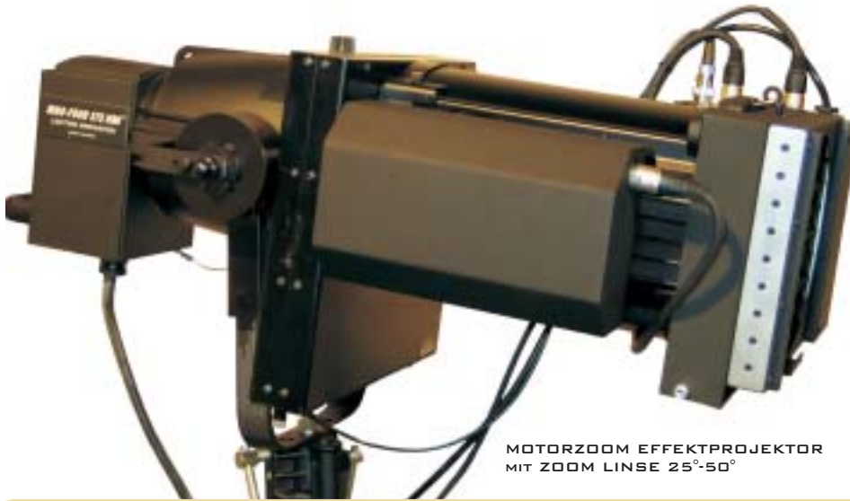
MOTORZOOM EFFEKTPROJEKTOR MIT ZOOM LINSE 25°-50°

Niemals zuvor war ein solch kraftvoller Effektprojektor in dieser Kompaktheit verfügbar. Darüber hinaus lassen sich alle Effektparameter mit DMX 512 steuern.