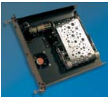
Einschub für Filmlaufwerk

Die INNO DIM 170™ electronic macht es Ihnen möglich die intensive Tageslicht-Projektion auf- und abzublenden, den Lichtkegel dank des Motor-Zooms auf die gewünschte Größe und Schärfe zu beamen und die Geschwindigkeit und Drehrichtung der Effekte Ihren Vorstellungen gemäß anzupassen. Das alles programmierbar über Ihr Lichtsteuerpult. So übernehmen Sie die totale Kontrolle über Ihre Effekt-Projektion.